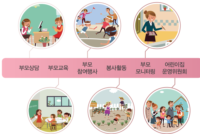
[어린이집 부모 참여]