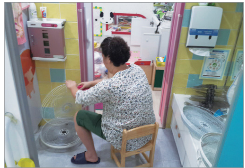
장난감 세척 자원봉사