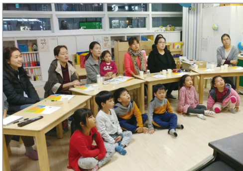
특별활동 수업 선별

자격요건이 된다면 자치구의 부모모니터링단 단원이 되어 활동할 수 있습니다. 우리 어린이집을 넘어서 내가 사는 지역사회의 보육환경을 지원하는 역할을 하게 됩니다.