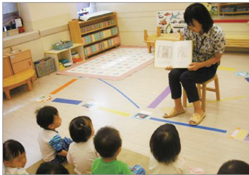
책 읽어주는 엄마