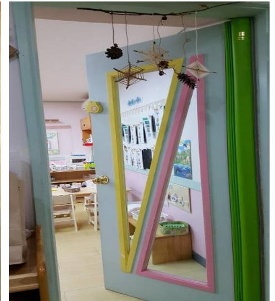
보육실 문 투명창