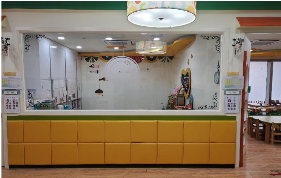
복도에서 통하는 창문

복도 및 보육실 창은 보육실 외부에서 상시 관찰이 가능하도록 스티커, 반투명, 장식물, 커튼 등 부착 금지